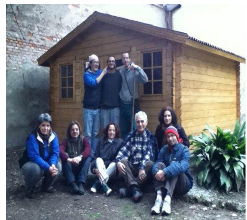
la nostra fattoria “orto e giardino”